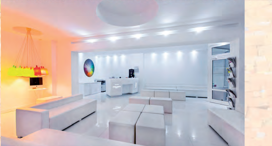
Votre hôtel Design dans Paris